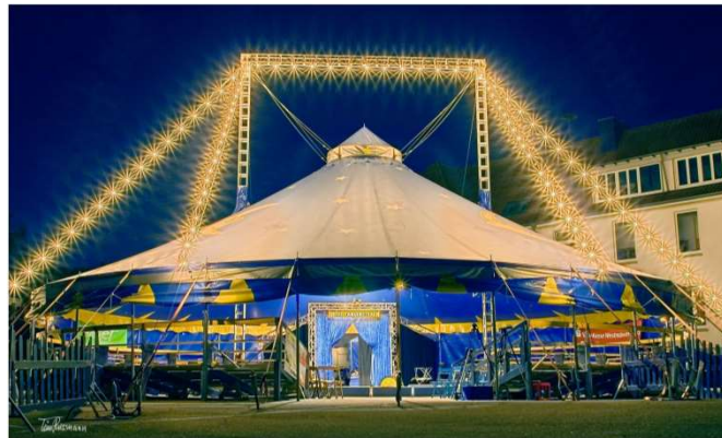
Rudolf-Bracht Grundschule Mastholte Circus Tausendtraum